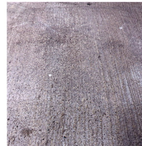
Grenailage à sec avec billes d'acier.

Sol représentant toutes les complications qu'un applicateur peut rencontrer: sale, rugueux, absorption irrégulière, cavités, fissures, etc.