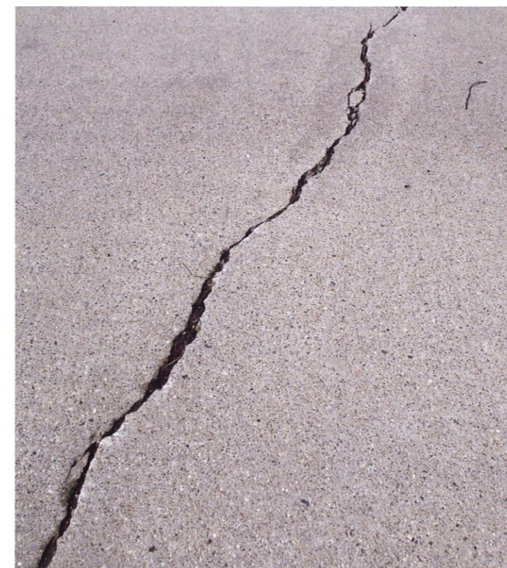
Les fissures au sol : une analyse des fonds est recommandée avant le traitement.

Selon les largeurs des fissures présentes et des mouvements prévisibles des fissures, il faut prendre des mesures de remise en état correspondantes ou choisir des systèmes de revêtement pontant les fissures.