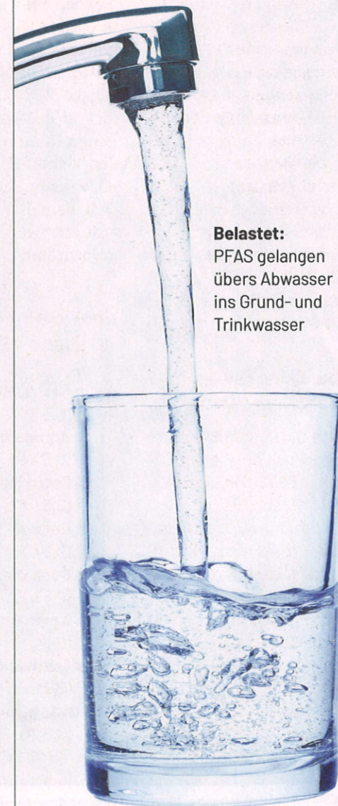
Belastet: PFAS gelangen übers Abwasser ins Grund- und Trinkwasser

■ Geschirr: Einweggeschirr aus Karton ist vielfach mit PFAS behandelt. Mehrweggeschirr aus Glas oder Porzellan ist umweltfreundlicher.