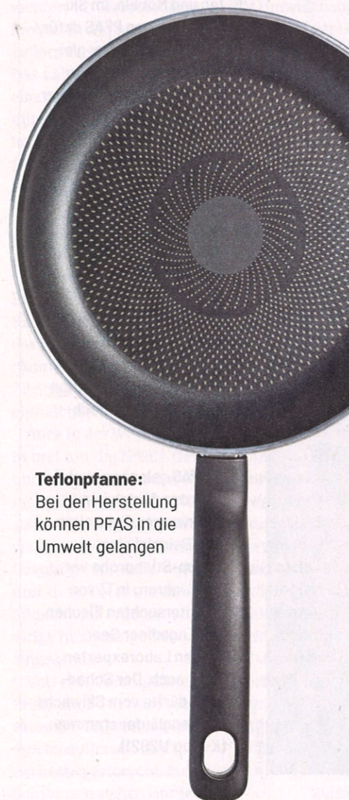
Teflonpfanne: Bei der Herstellung können PFAS in die Umwelt gelangen

■ Resultate der Trinkwasserproben aus 477 Gemeinden ab Seite 16