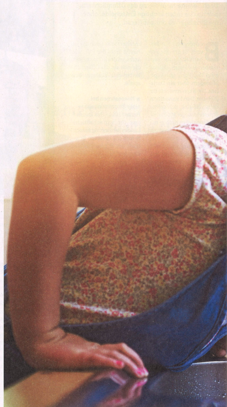
Hahnenwasser: Fast 400 der 872 Wasserproben von K-Tipp-Lesern enthielten PFAS-Sc

Die Europäische Behörde für Lebensmittelsicher-