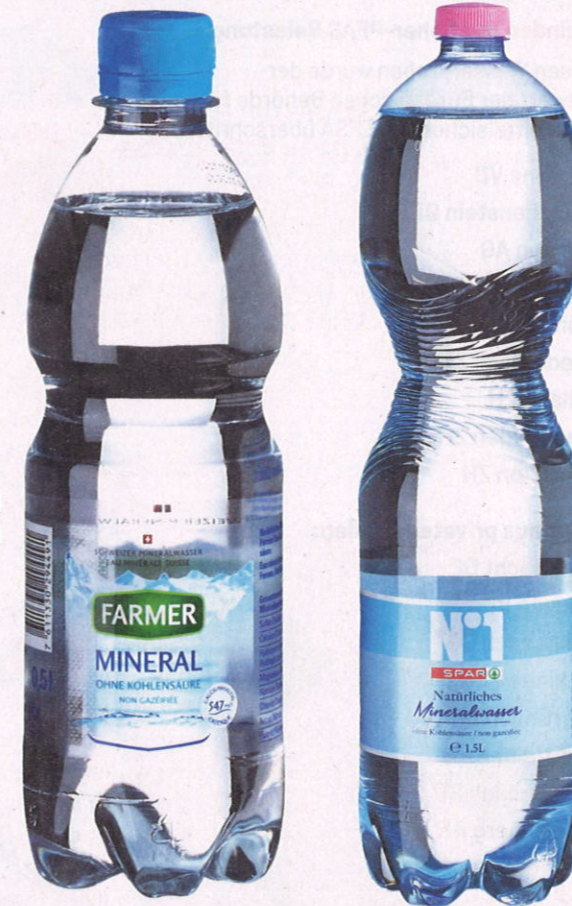
Verunreinigt: Farmer Mineral und Spar Nr. 1