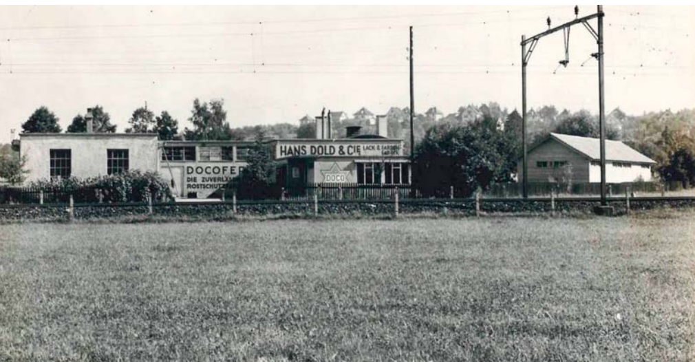
Produktionsgebäude in Wallisellen 1921.

Text und Bilder Dold AG 1921 wurde die Hans Dold & Co. gegründet. Heute zählt das Walliseller Unternehmen zu den führenden Lack- und Farbenherstellern in der Schweiz. Neben hochwertigen Farb- und Lacksystemen für den professionellen Baumeister bietet die Dold AG auch Lösungen für Industriekunden – und in Synergie mit der Schwesterfirma IGP Pulvertechnik AG ein abgestimmtes Systemlack-Konzept.